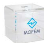
Mofém csaptelep bemutató (Easy fix) Érdeklődjön területi képviselőjénél!