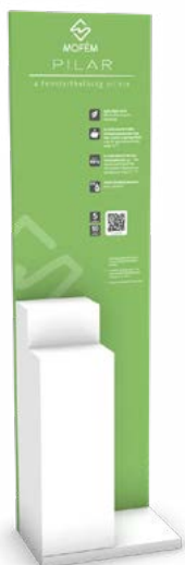
Pilar bemutatófal 509-0033-91