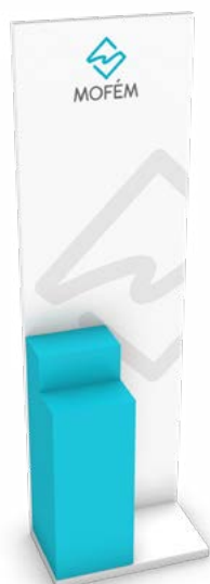
Mofém csaptelep bemutatófal 509-0003-91 (DOBOGÓVAL) 509-0013-91 (DOBOGÓ NÉLKÜL) 509-0023-91 (DUPLA DOBOGÓVAL)