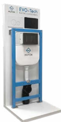
Mofém WC program bemutatófal 509-0003-20