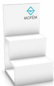
Hello asztali bemutatófal 509-0043-93