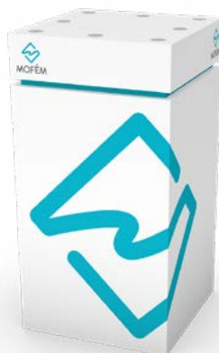
Mosogató és mosdó csaptelep bemutatófal 509-0003-92