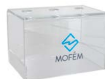
Mofém csaptelep bemutató (Easy fix) 3db álló csaptelephez Érdeklődjön területi képviselőjénél!