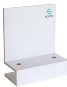
Asztali bemutatófal 509-0023-93