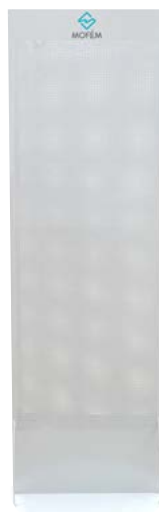
Mofém Zuhanyprogram és Fiesta bemutatófal 509-0003-23