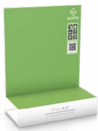
Pilar asztali bemutatófal 509-0013-93