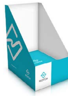
Mofém bokszaletta 509-0003-99